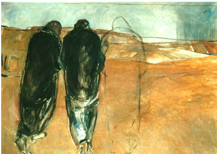
terug naar huis in Emmaüs

Wij vieren de Hemelvaart van Jezus veertig dagen na Pasen want zo staat dat in de Handelingen van de Apostelen (Hand. 1,3). Maar Lucas, de auteur van dat boek, schrijft in zijn evangelie dat Jezus ten hemel voer op de eerste dag na zijn verrijzenis (Luc. 24,1.13.36.50-51). Spreekt de evangelist zichzelf dan tegen? Op het eerste gezicht doet hij dat ongetwijfeld, zeker als je die teksten leest als kalenderaanduidingen. Maar Lucas is geen kalender- of agenda-organisator. Bij de vermelding van veertig dagen moeten we goed op onze hoede zijn, want veertig is een getal dat vaker voorkomt in de Bijbel. Het gaat dan om de symbolische aanduiding van een lange tijd, vaak een tijd van voorbereiding op wat komen gaat, zoals de veertig jaren dat de Hebreëen door de woestijn trokken op weg naar het Beloofde Land, de tocht van veertig dagen van de profeet Elia